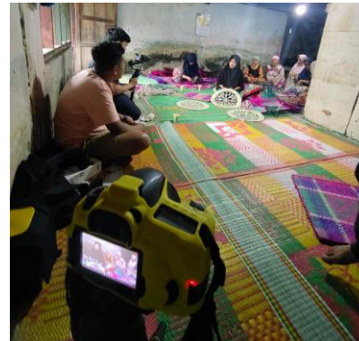
Gambar 4. Lokasi tempat produksi

suara lingkungan akan menjadi pertimbangan utama untuk menjaga keaslian dan nuansa lokal dalam dokumenter ini. Tahap Pasca Produksi kemudian akan melibatkan proses editing yang cermat untuk menyusun gambar dan suara menjadi sebuah narasi yang kohesif, termasuk penambahan musik, narasi suara, dan efek suara yang diperlukan. Dengan demikian, setiap tahap dalam perancangan film dokumenter ini dirancang untuk menghasilkan sebuah karya yang informatif, inspiratif, dan mampu memperlihatkan keunikan serta kekayaan budaya Desa Koto Dian kepada audiens yang lebih luas. Lihat pada gambar 4 yang tersaji dibawah ini.