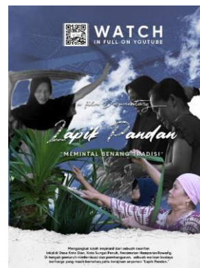
Gambar 13. Poster

Media pendukung dalam bentuk media cetak untuk film dokumenter "Lapik Pandan Koto Dian" dapat mencakup berbagai elemen yang mendukung promosi dan informasi tentang film tersebut. Beberapa media tersebut seperti poster, x-banner, topi, mug, t-shirt, totebag, stiker. Lihat pada gambar 13 sampai dengan gambar 18 dibawah ini.