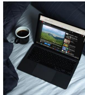
Gambar 12. Aplikasi ke sosial media (youtube)