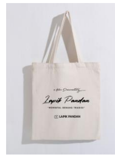
Gambar 18. totebag