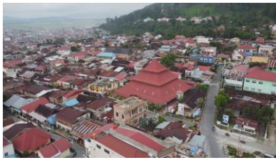
Gambar 4. lokasi tampak luas

Selanjutnya, proses penulisan sinopsis menjadi tahap penting dalam Pra Produksi ini. Sinopsis akan menyajikan gambaran umum tentang alur cerita film, mencakup pengenalan karakter, perkembangan plot, konflik utama, dan resolusi. Dengan sinopsis yang kuat, tim produksi dapat memiliki panduan yang jelas dalam menyusun naskah dan mengarahkan pengambilan gambar. Naskah, sebagai kerangka kerja utama dalam produksi, akan dikembangkan secara detail untuk memastikan bahwa semua elemen cerita yang penting tercakup dengan baik dan sesuai dengan visi kreatif yang telah ditetapkan. Lihat pada tabel 2 storyboard dan tabel 3 sinopsi dalam bentuk penggalan singkat.