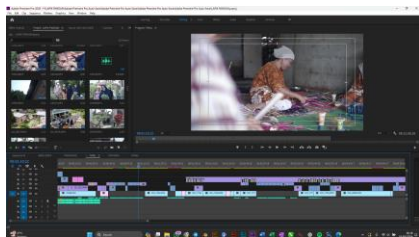
Gambar 9. Proses editing

Tahap Pasca Produksi melibatkan proses editing yang cermat untuk mengatur dan menyatukan gambar dan suara menjadi sebuah narasi yang kohesif. Tim editor menambahkan elemen-elemen penting seperti musik, narasi suara, dan efek suara yang diperlukan untuk meningkatkan pengalaman visual dan auditif bagi penonton. Setelah proses editing selesai, film menjalani tahap tinjauan ulang untuk memastikan bahwa hasil akhir sesuai dengan visi kreatif yang telah ditetapkan sejak awal. Harapan dari metode ini adalah menghasilkan sebuah dokumenter yang tidak hanya memberikan informasi yang mendalam, tetapi juga menginspirasi, serta berhasil memperlihatkan keunikan dan kekayaan budaya Desa Koto Dian kepada audiens yang lebih luas. Lihat pada gambar 9 sampai dengan gambar 12 dibawah ini.