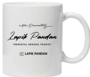
Gambar 16. Mug