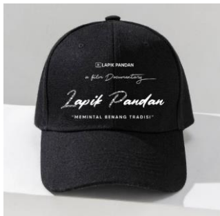
Gambar 15. Topi