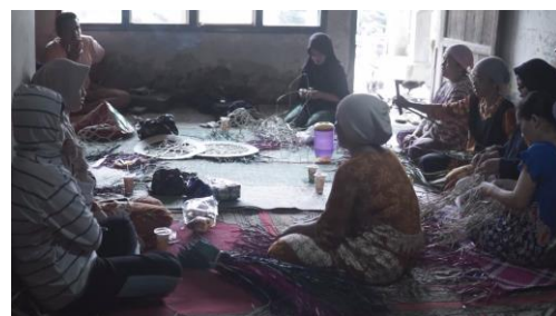
Gambar 3. Komunitas