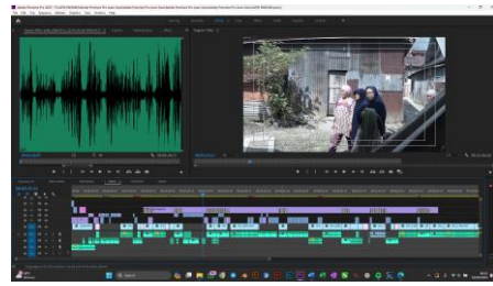
Gambar 10. Proses editing suara