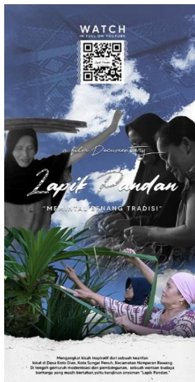
Gambar 14. X-banner