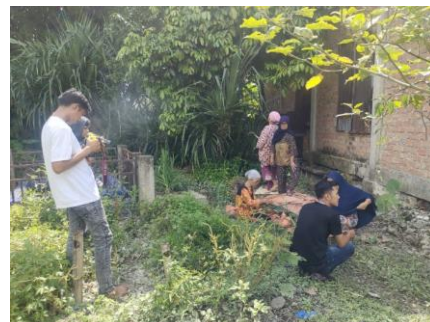
Gambar 5. Shooting 1

Pada tahap Produksi, tim dokumenter fokus pada merekam berbagai aspek kehidupan sehari-hari masyarakat Desa Koto Dian, termasuk upacara adat yang penting bagi budaya lokal. Mereka memilih lokasi dan waktu yang tepat untuk menjaga keaslian adegan yang mereka rekam. Pencahayaan alami sangat diperhatikan agar tidak hanya menghasilkan gambar yang jelas tetapi juga menangkap nuansa atmosfer yang tepat sesuai dengan konteks budaya yang dipaparkan dalam film dokumenter ini. Selain itu, pengaturan suara lingkungan juga menjadi prioritas, di mana tim berusaha untuk merekam dengan seakurat mungkin agar suara-suaranya mencerminkan kehidupan sehari-hari dan kekayaan lingkungan Desa Koto Dian secara autentik. Lihat pada gambar 5 sampai dengan gambar 8 ini.