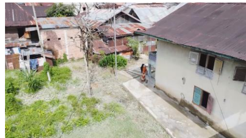
Gambar 2. Desa Koto Dian

Tahap Pra Produksi mencakup beberapa langkah penting, termasuk penentuan tema musik, penulisan sinopsis, dan pengembangan naskah. Penentuan tema musik dimulai dengan penelitian mendalam tentang instrumen musik tradisional yang digunakan di Desa Koto Dian dan wilayah sekitarnya, seperti gendang, seruling, dan rebab. Musisi lokal dilibatkan dalam proses ini untuk memastikan keaslian dan relevansi musik yang digunakan. Sesi rekaman dilakukan baik di studio maupun di lokasi alam terbuka untuk menangkap nuansa dan keaslian musik tradisional. Musik kemudian dipilih dan diedit agar sesuai dengan alur dan emosi yang ingin disampaikan dalam film, dengan pengaturan tempo, nada, dan dinamika yang tepat. Lihat gambar 2 sampai dengan gambar di bawah ini.