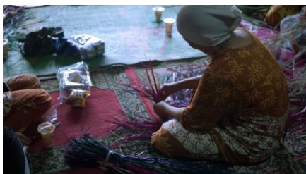
Gambar 8. Shooting 4