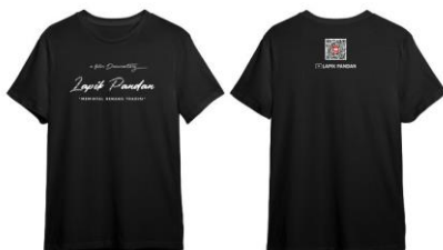
Gambar 17. T-shirt