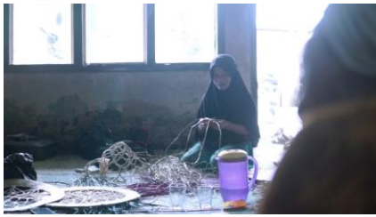
Gambar 6. Shooting 2