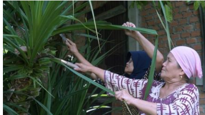
Gambar 7. Shooting 3