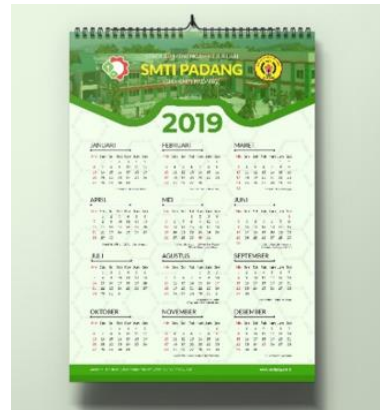
Gambar 13. Media Kalender