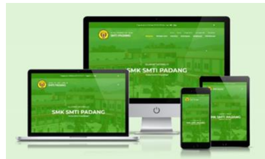
Gambar 5. Media Responsive Web Design