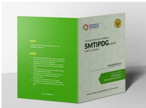
Gambar 10. Stopmap