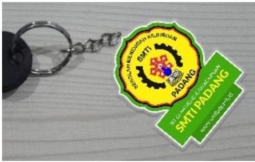
Gambar 8. Media Gantungan Kunci