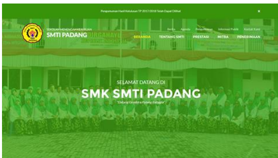
Gambar 2. Desain Above The Fold 1