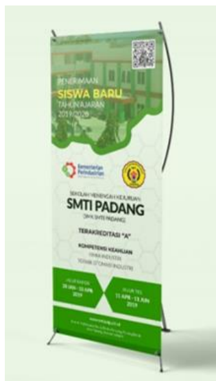
Gambar 11. X-banner