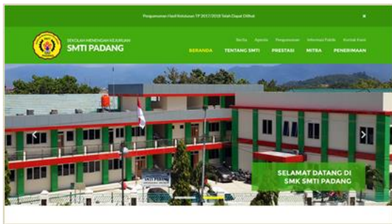
Gambar 1. Desain Above The Fold 1