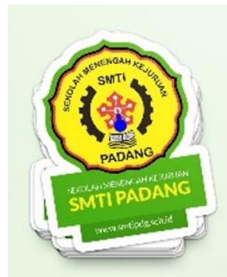
Gambar 7. Stiker