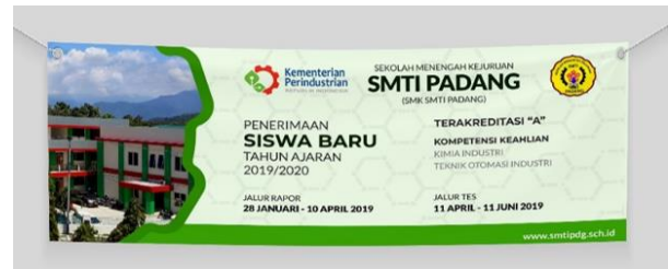
Gambar 14. Spanduk