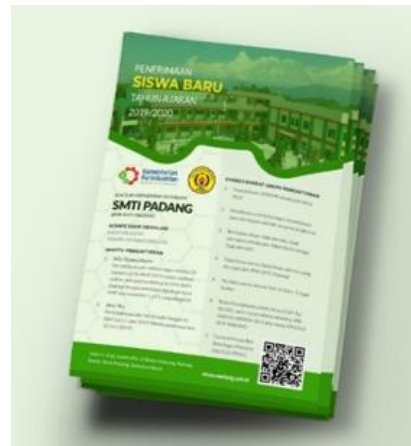
Gambar 6. Media Flyer