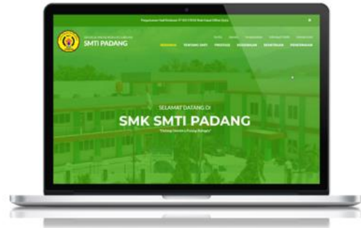
Gambar 4. Final website