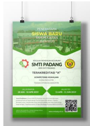
Gambar 12. Media Poster