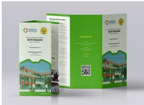
Gambar 9. Media Brosur